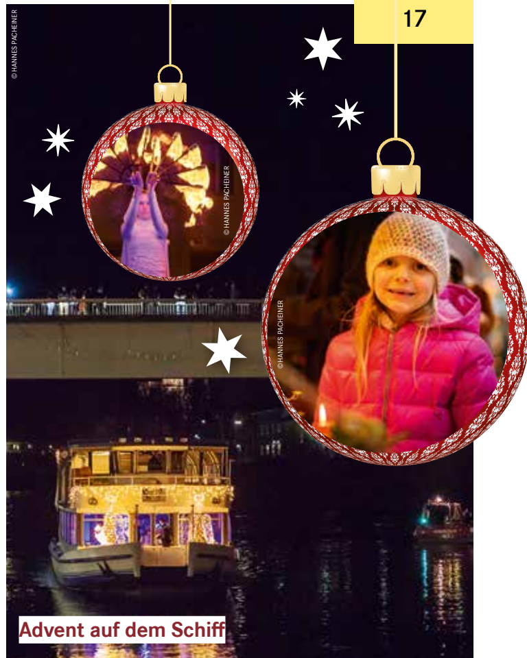
Advent auf dem Schiff

ADVENT AUF DEM SCHIFF. Unterwegs ist heuer auch wieder das Drauschiff, die MS Landskron. Bei den Lichterfahrten an den Wochenenden und am 8. Dezember kann man den Adventzauber mit kulinarischen Köstlichkeiten genießen. Ab 25. November legt die Landskron um 16.30 Uhr ab. drau-schiffahrt.at