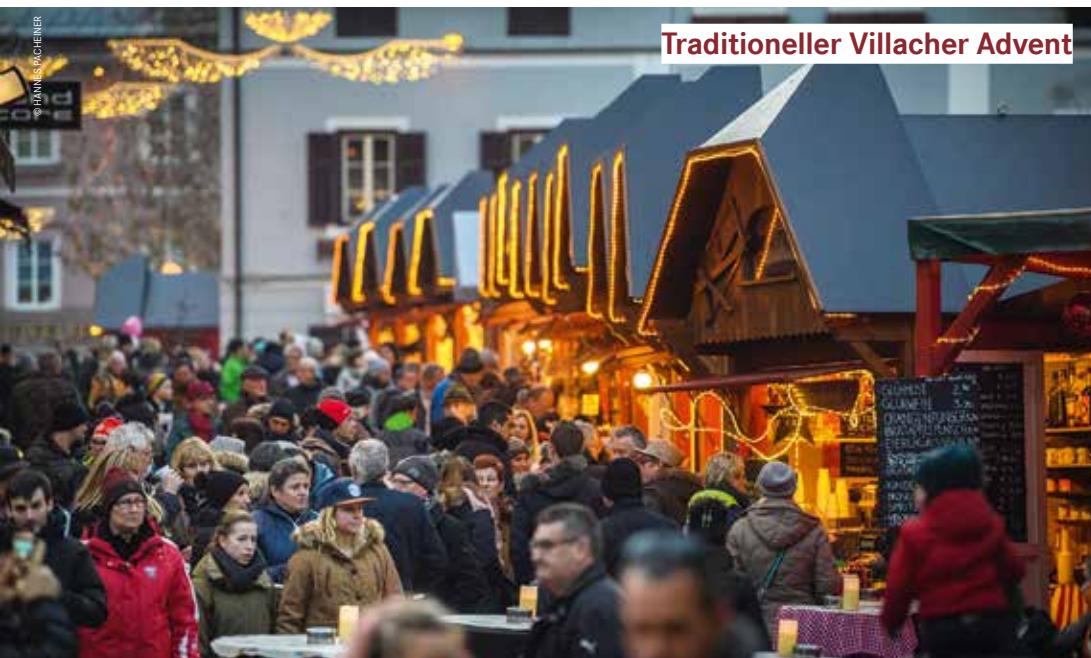
Traditioneller Villacher Advent