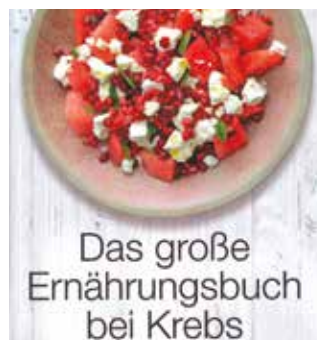
BUCHCOVER KNAUER MESSANA