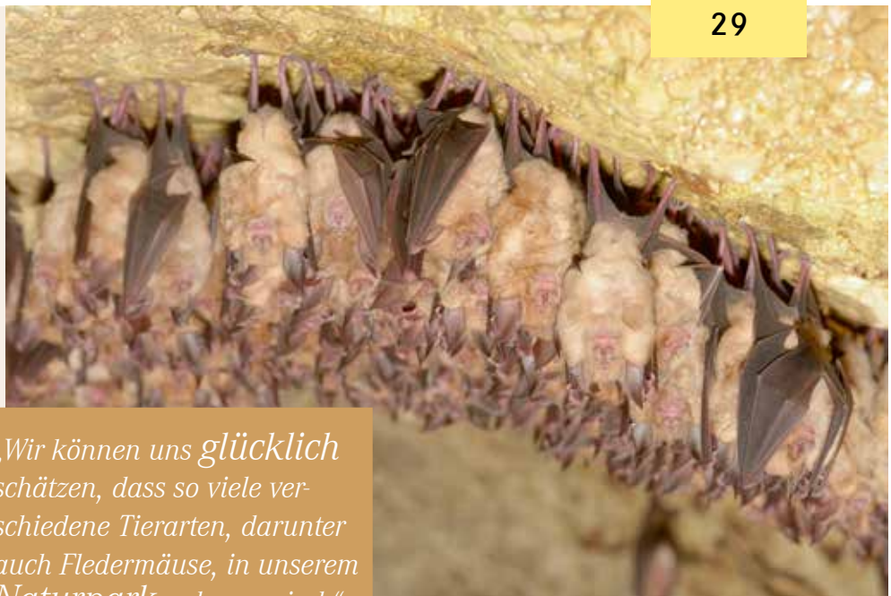
Das Eggerloch ist ein ideales Winterquartier für die geschützten Fledermausarten.

Das Eggerloch in Warmbad ist ein Naturjuwel, in dem seltene Tierarten leben.