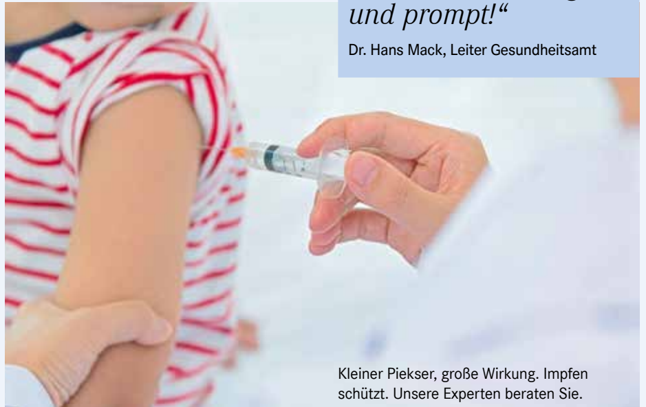
Kleiner Piekser, große Wirkung. Impfen schützt. Unsere Experten beraten Sie.

Checken Sie bitte, ob Ihr Impfschutz auch wirklich aktuell ist.