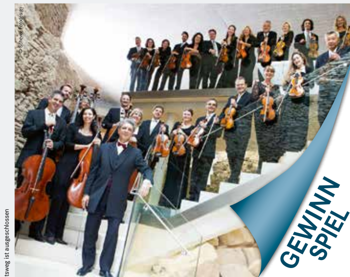
Der Rechtsweg ist ausgeschlossen

„Einstieg ins Internet für Frauen 50+“, Volkshochschule (Widmannngasse 11), 8.15 Uhr