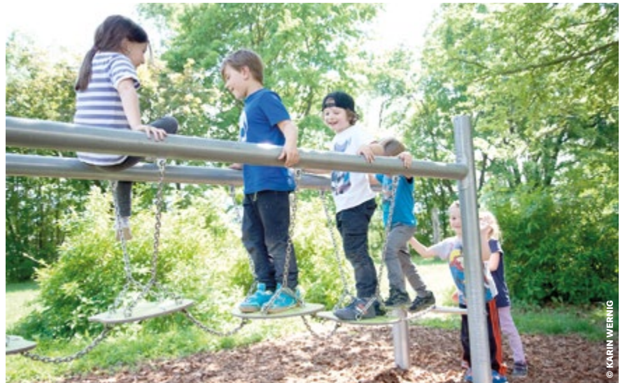
Das kostenlose Bewegungsangebot für die Villacher Kinder und Jugendlichen besteht im gesamten Stadtgebiet an vielen Orten.

zeitanlagen zum Nulltarif: Silbersee, Naturpark Dobratsch, das weitläufige Warmbad, Panorama Beach in Drobolach, Wasenboden, der Motorikpark im Park St. Martin und hunderte Kilometer an Radwegen. [tk]