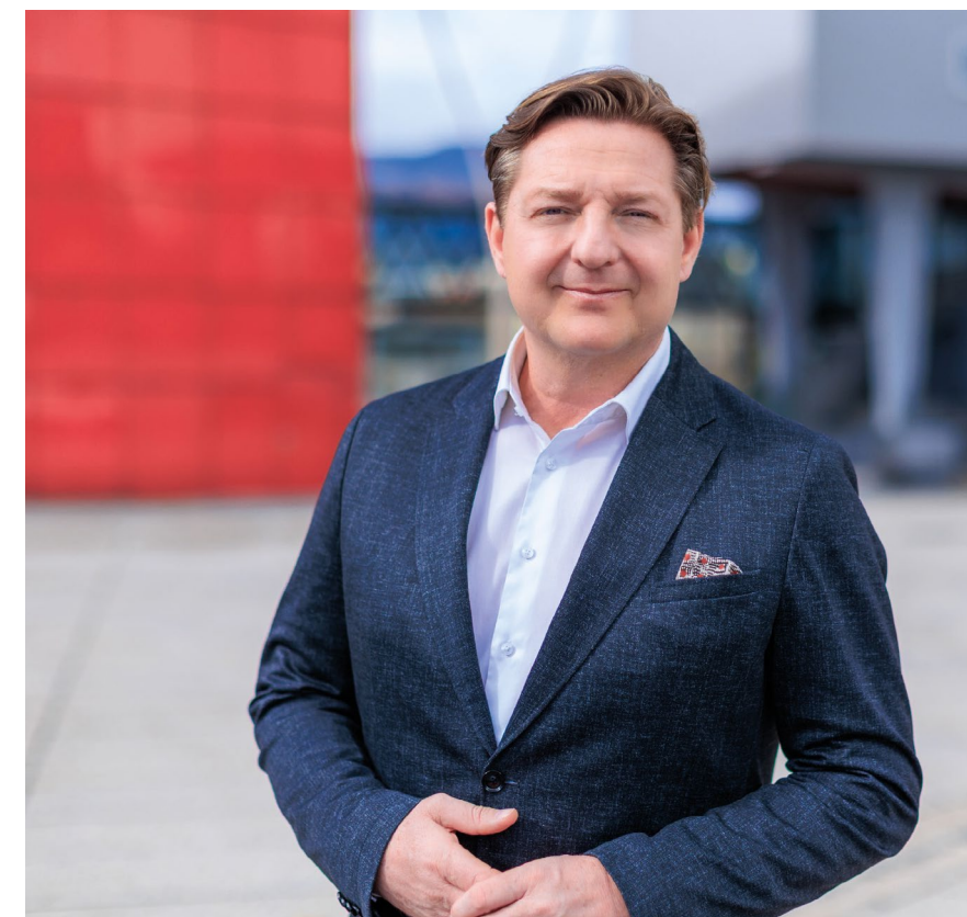
Gemeindewohnungen in der Stadt Villach: Künftig sollen bessere Deutschkenntnisse Voraussetzung für die Vergabe von städtischen Wohnraum sein.

besprechen kann, dass um Mitternacht keine Waschmaschine mehr in Betrieb genommen werden sollen,