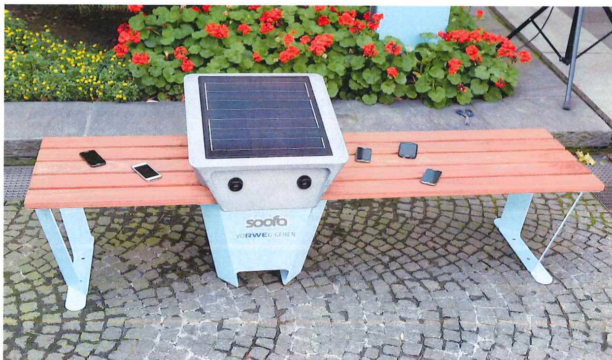
Soofa Smartbench© http://www.rwe.com ; https://www.resorti.de