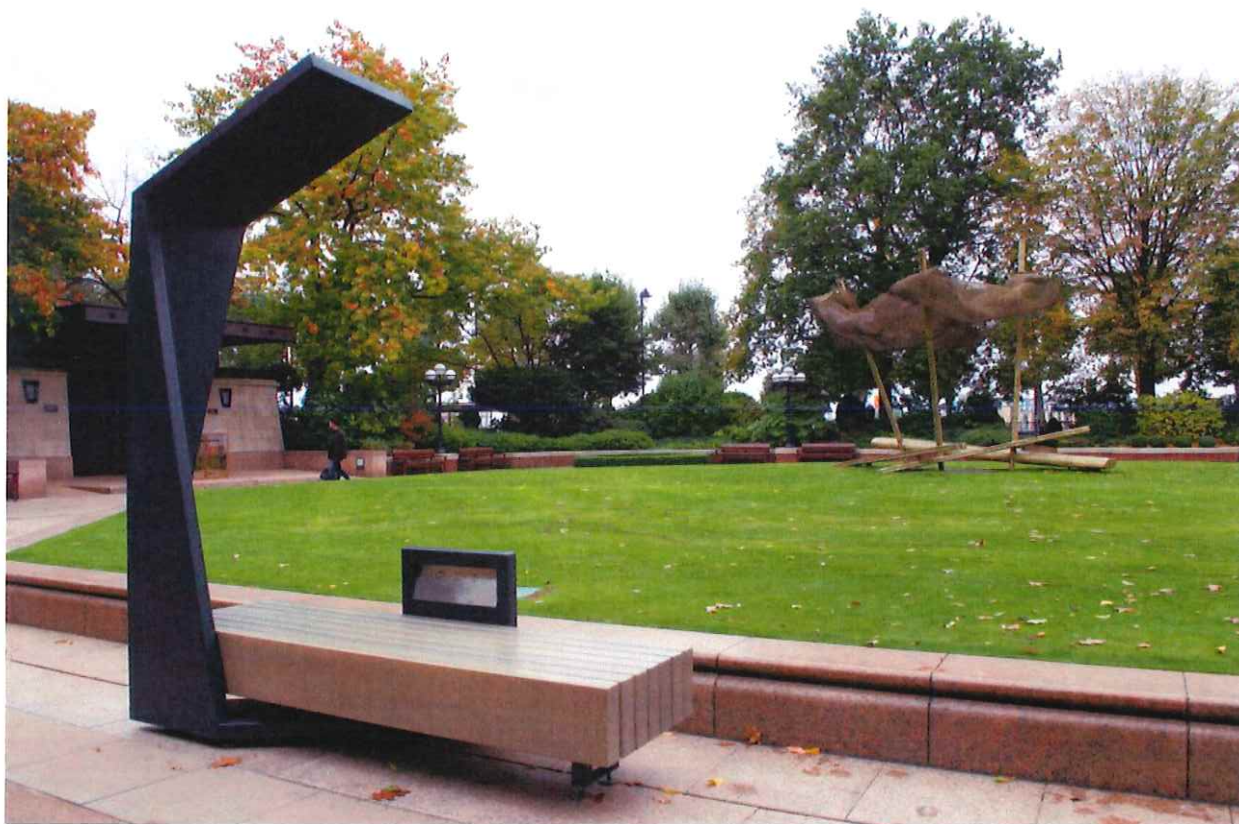
Strawberry Smartbench© http://www.fullcapacity.cz