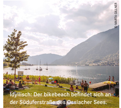
Idyllisch: Der bikebeach befindet sich an der Süduferstraße des Ossiacher Sees.

Zusätzlich bietet die Stadt zwei Strandbäder mit fairem Eintritt an (campingbeach Annenheim und sunsetbeach Egg). Alle Infos im Überblick: villach.at/baeder