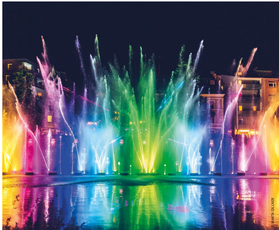
Farbenfroh: Die DRAUpuls Lichtershow lädt Besucher:innen ab 19. Juni wieder auf die Drauterrassen ein. Zum Auftakt lautet das Motto: „Italo Hits“.