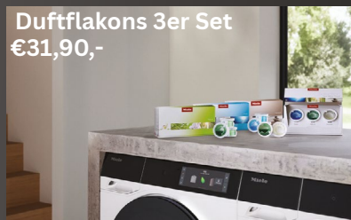
Duftflakons 3er Set € 31,90,-