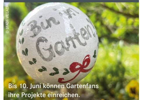
Bis 10. Juni können Gartenfans ihre Projekte einreichen.