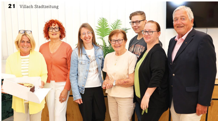
21 Villach Stadtzeitung

Sprechtag: Termine nach Vereinbarung, Rathaus, Eingang II, 3. Stock, Zimmer 301 Gehörlosensprechtag: Termin nach Vereinbarung Kontakt: T 0 42 42 / 205-1133 E: gerda.sandriesser@villach.at