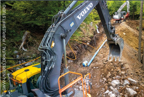
Zwischen Villach, Paternion und Weißenstein wird längst gegraben.

Im Bereich Weißenstein/Paternion/Villach werden bereits Leitungen verlegt, um die Gemeinden besser zu vernetzen. Herzstück der Wasserschiene wird die Verbindung Klagenfurt-Villach sein. Noch heuer werden die Pläne beim Land Kärnten eingereicht. Möglicher Baubeginn: 2028.