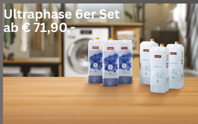
Ultraphase 6er Set ab € 71,90,-