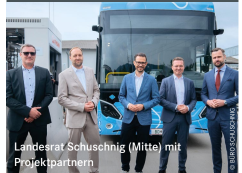
Landesrat Schuschnig (Mitte) mit Projektpartnern

Der grüne Wasserstoff stammt aus der Kelag-Elektrolyseanlage in Arnoldstein. Die Busse erreichen mit einer Tankfüllung bis zu 400 Kilometer Reichweite. Darüber informierte kürzlich Landesrat Sebastian Schuschnig.