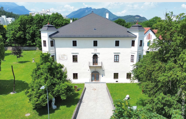
Das Dinzschloss wird zur Plattform für „Wir sind Kultur“.

„Wir sind Kultur“ MI, 17. Juni, Dinzschloss, ab 16 Uhr