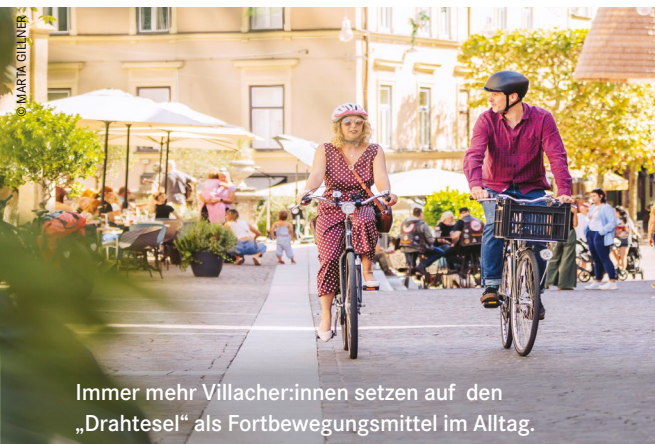
Immer mehr Villacher:innen setzen auf den „Drahtesel“ als Fortbewegungsmittel im Alltag.