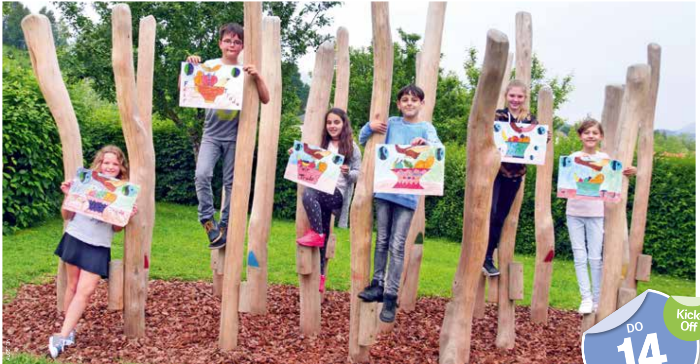
Die Schülerinnen und Schüler der VS 9 in Fellach engagieren sich begeistert für das Thema Fairtrade und haben sich für die große „Kick-Off“-Veranstaltung am 14. Juni schon bestens vorbereitet.