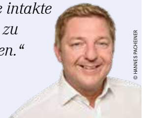
Bürgermeister Günther Albel

„Wir sind verpflichtet, schon jetzt Maßnahmen zu treffen, um unseren Nachkommen eine intakte Umwelt zu hinterlassen.“