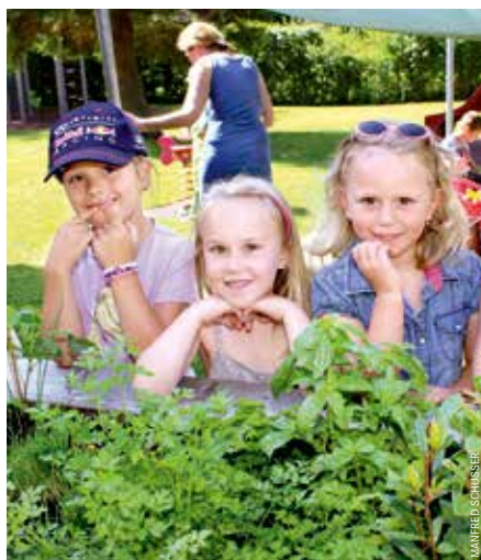
In Villachs Kindergärten steht täglich Bio-Essen auf dem Speiseplan. Inklusive Kräuter aus dem eigenen Garten.

Die Umweltschutz-Organisation Greenpeace hat Österreichs Schul- und Kindergartenessen unter die Lupe genommen. Kernfrage: Wie Bio ist die Verpflegung der Kinder? Kärnten belegt dabei in der Bundesländerwertung den 3. Platz. Besonders erfreulich: Als vorbildlich wird Villach gesehen. Mit einer einzigartigen Bio-Quote von 65 Prozent sei man weit über der vom Land Kärnten 2014 beschlossenen Vorgabe, 30 Prozent der Nahrung mögen biologisch und regional sein. Zudem sei Villach „der Beweis dafür“, dass Bio nicht teuer sein muss, sagt Greenpeace-Sprecher Sebastian Theissing-Matei: Der Wareneinsatz für eine Mahlzeit belaufe sich trotz hohem Bio-Anteil nur auf rund 70 Cent. Auffällig seien die starken regionalen Unterschiede in Kärnten: