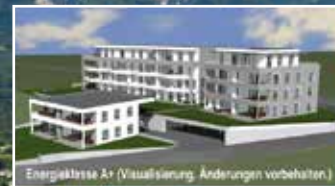
Energieklasse A+ (Visualisierung, Änderungen vorbehalten)

Seeblick • Tiefgaragenplätze Gartenflächen • Terrasse • Kamin Jede Infrastruktur, Einkaufsmöglichkeiten, Bus zu Fuß erreichbar. Nur wenige Gehminuten zum öffentlichen Strandbad.