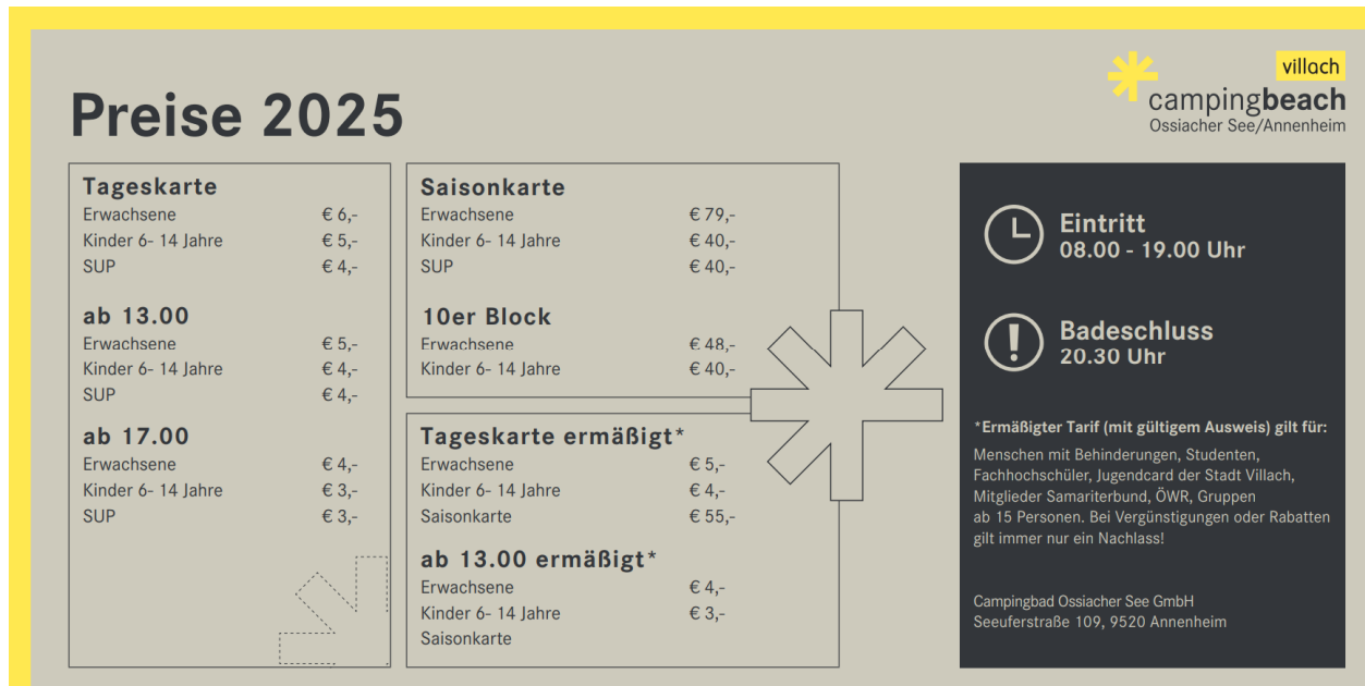
Abb. 4: Eintrittspreise Strandbad 2025 11

Für das Jahr 2025 waren folgende Eintrittspreise für Badegäste festgelegt: