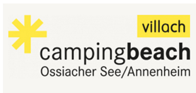
Abb. 3: Logo campingbeach 10

Im Gegensatz zu den zahlreichen Freibädern im Stadtgebiet von Villach ist für die Benutzung des campingbeach, sowohl für das Baden als auch für das Campieren, ein Entgelt zu entrichten.