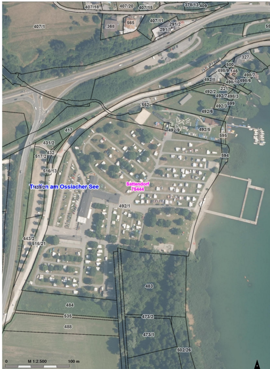
Abb. 5: Lageplan campingbeach (KAGIS) 12

Zu den Pachtzinseinnahmen hat der StRH recherchiert, dass die Stadt Villach grundbücherliche Alleineigentümerin der Liegenschaft EZ 267 KG 75444 Sattendorf, bestehend aus dem Grundstück 492/5 (4.879 m 2 ) und dem Grundstück 595 (237 m 2 ), ist. Diese Grundstücke grenzen an das Areal des Campingbads an und werden von der Stadt Villach zur touristischen Nutzung verpachtet.