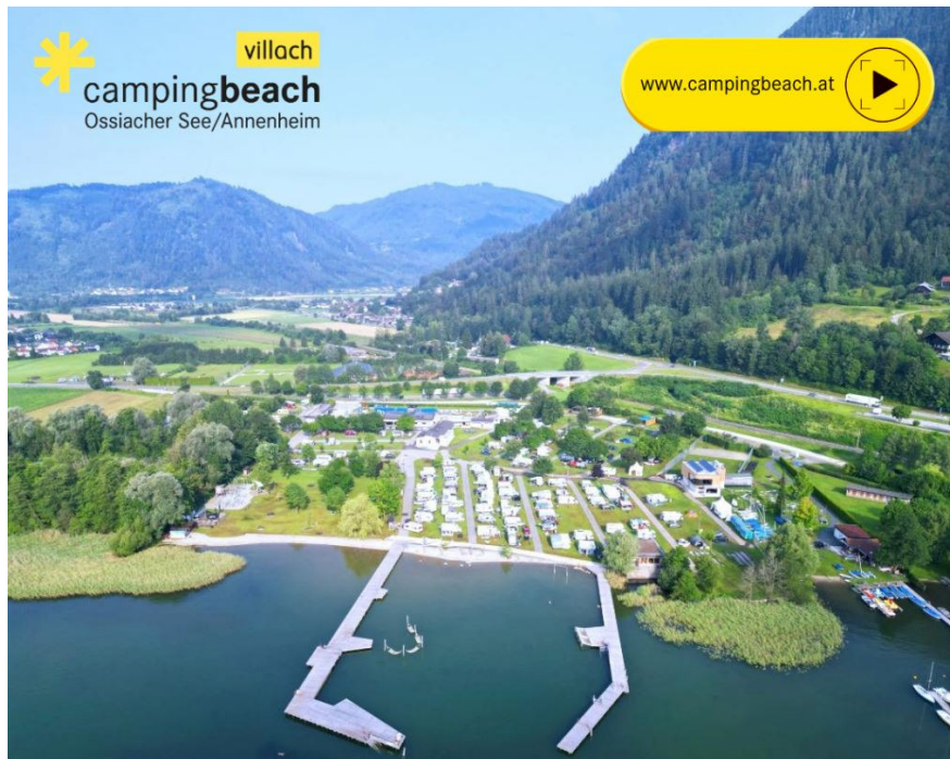
Abb. 2: Luftaufnahme campingbeach 8

Das nachfolgende Bild zeigt eine aktuellere Luftaufnahme des Areals: