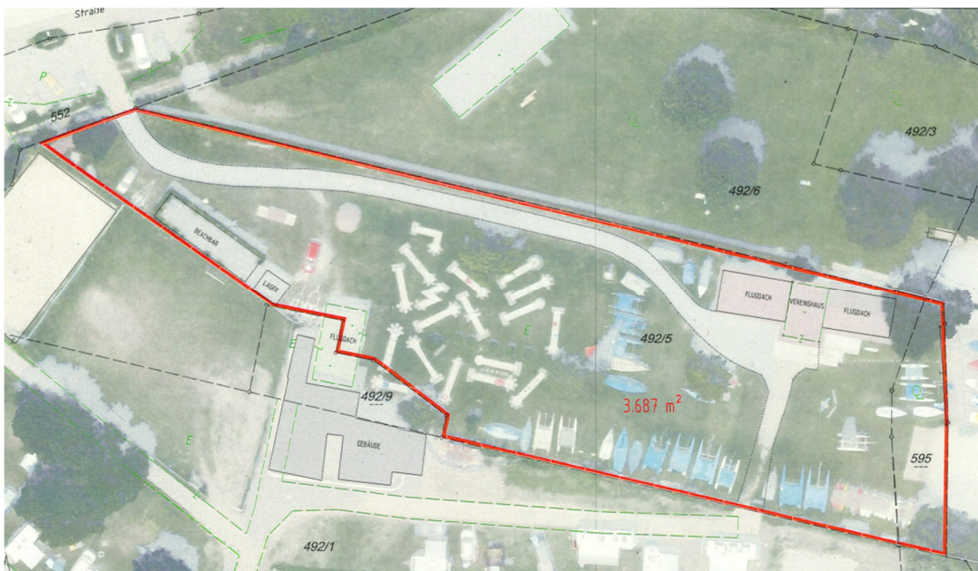
Abb. 6: Pachtflächenplan Surf- und Segelschule 13

Der Pachtflächenplan der Abteilung Vermessung und Geoinformation (2/VG) weist dazu eine verpachtete Gesamtfläche von 3.687 m 2 aus, die sich aus einem Anteil von 3.450 m 2 des Grundstücks 492/5 sowie aus 237 m 2 des Grundstücks 595 zusammensetzt.