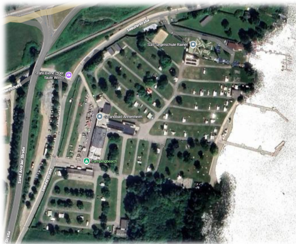
Abb. 1: Lageplan campingbeach 7

Die Luftaufnahme zeigt das Campingbad-Areal nach dem Um- und Ausbau: