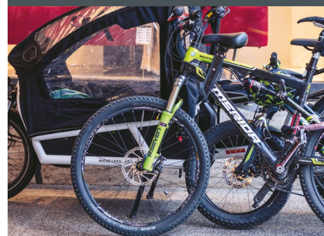
Immer mehr Villacher:innen setzen im Alltag auf den „Drahtesel“.