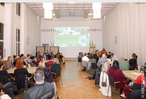
Die Auftaktveranstaltung fand Ende Februar im Paracelsussaal statt.

Am Ende wird ein Rahmen für die städtische Integrationsarbeit stehen, der das Zusammenleben gezielt stärkt - insbesondere dort, wo es nicht von selbst entsteht.