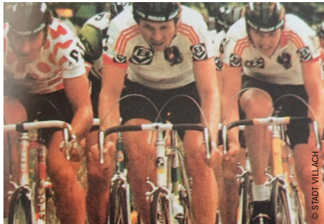
Die weltbesten Junioren treffen sich bei der Rad-Weltmeisterschaft in Villach.