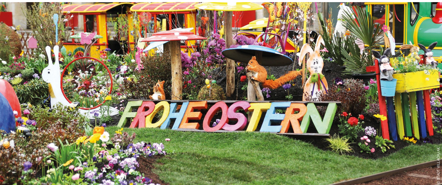
Farbenfroh präsentiert sich der Rathausplatz zu Ostern. Der Kinderzug dreht seine Runden um die Blumenlandschaft.