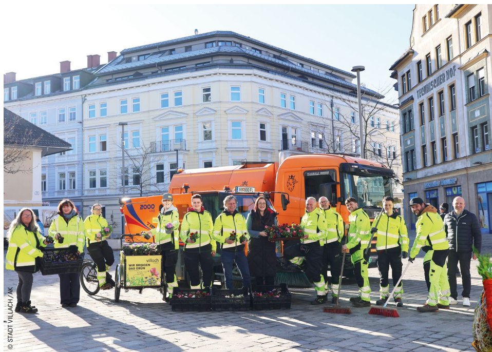
Sie bringen den Frühling in die Stadt: Vizebürgermeisterin Sarah Katholnig mit einem Teil der Mitarbeiter:innen von Wirtschaftshof und Stadtgrün.

Parallel dazu kümmert sich die Abteilung Stadtgrün um die Säuberung von Villachs Parkanlagen. „Zudem werden rund 19.200 Viole und 1.500 Bellis ausgepflanzt“, sagt Vizebürgermeisterin Katholnig. Der Zeitplan der Mission „alles bunt“: Bis Anfang April soll ein Großteil der Pflanzungen abgeschlossen sein. Die Villacher:innen können sich unter anderem über die Blumenbänke auf dem Hauptplatz freuen, zudem schmücken die Blumenscheibtrühen wieder die Innenstadt. Sobald die Blumen eingesetzt sind, heißt es natürlich: „Bitte regelmäßig gießen“. Insgesamt betreut die Stadt rund 50 Blumenanlagen. Hinzu kommen 50.000 Quadratmeter an insektenfreundlichen Blumenwiesen. Für die warme Jahreszeit ist also alles „angeordnet“.