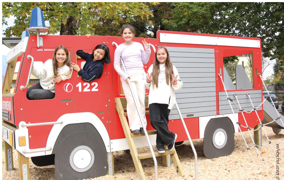
Im Khevenhüllerpark befindet sich der beliebte Feuerwehspielplatz. Er wird bis zum Sommer frei zugänglich und damit der 27. öffentliche Spielplatz in Villach.

Sprechtage: Mi, 9 bis 11 Uhr (nur nach Terminvereinbarung), Rathaus, Eingang I, 2. Stock, Zimmer 216 Kontakt: T 0 42 42 / 205-1006 E: sarah.katholnig@villach.at