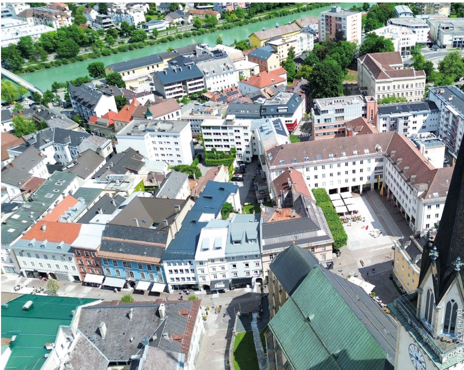
Das Innenministerium bewilligte vier weitere Sicherheitskameras in der Innenstadt. Diese werden zwischen Hauptplatz und Bahnhof installiert.

Hauptbahnhof montiert und eingesetzt werden. Schon bisher wurde in der Innenstadt auf die Unterstützung von Kameras gesetzt - allerdings meist im Zusammenhang mit den vielen Veranstaltungen, die Villach auszeichnen. Diese Kameras mussten jedes Mal auf- und dann wieder abgebaut werden. Die neuen Kameras bleiben dauerhaft. Besonders wichtig ist für Bürgermeister Günther Albel die digitale Kontrolle im Bereich des Hauptbahnhofes und bei der Draulände. „Hier gab und gibt es immer wieder Vorfälle und Beschwerden aus der Bevölkerung. Ich bin überzeugt, dass die Kameras gerade in diesen Zonen wichtige Dienste leisten werden“, sagt Bürgermeister Albel.