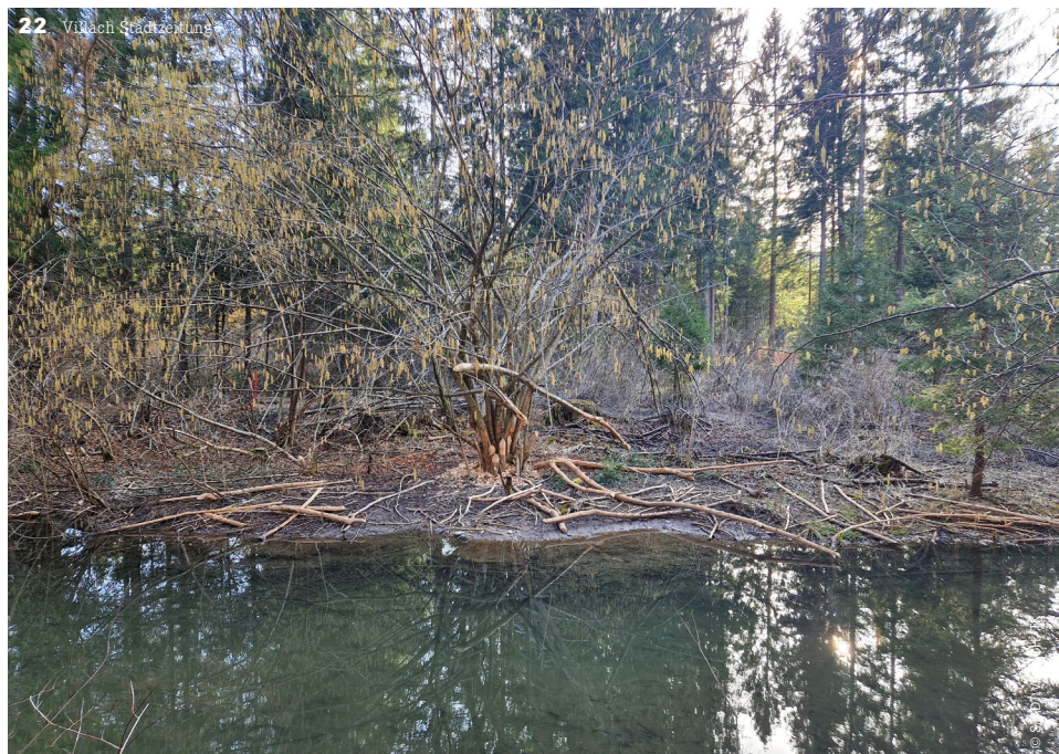
Schäden durch Biber sind entlang des Warmen Baches offensichtlich und reichen bis unter den bestehenden Hochwasserschutz-Damm.

Biberpopulation in Warmbad und Auen hat massive Schäden an Damm erzeugt. Diese wurden nun behoben.