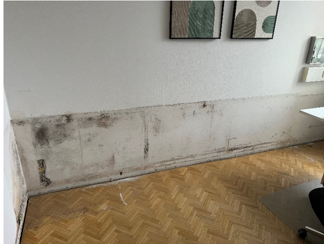
Abb. 2: Feuchtigkeitsschäden Leiterinnenbüro