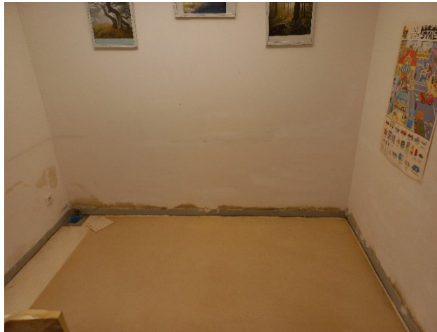
Abb. 3: Bodenöffnung im Zuge Schadenserkundung