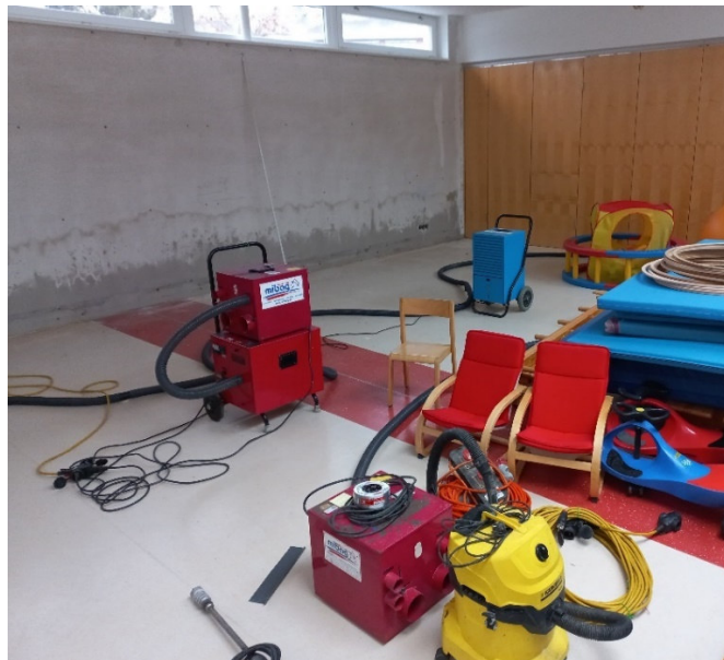
Abb. 5: Bauteiltrocknung

Beginn der Trocknung und der Schimmelbehandlung.