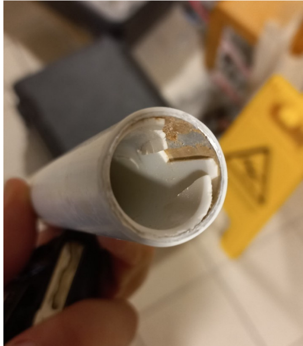
Abb. 4: Defektes Rohr Warmwasserleitung