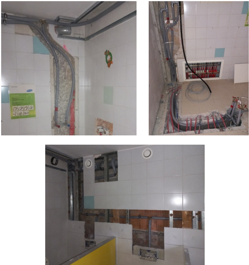
Abb. 6: Bauliche Sanierungsmaßnahmen

10.07.2024: Auftragsvergaben: HKLS- Installationsarbeiten und der Fliesenlegerarbeiten.